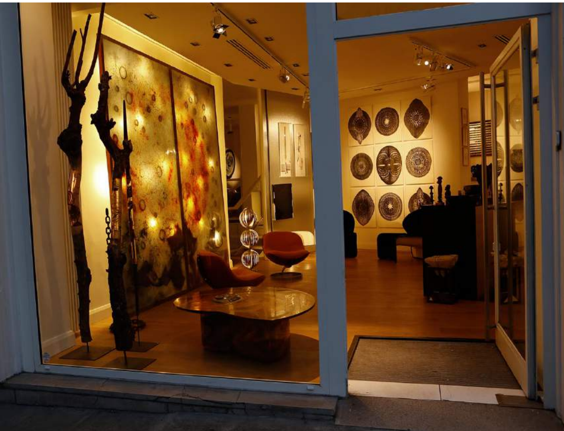
Symbiose – Paris 2017