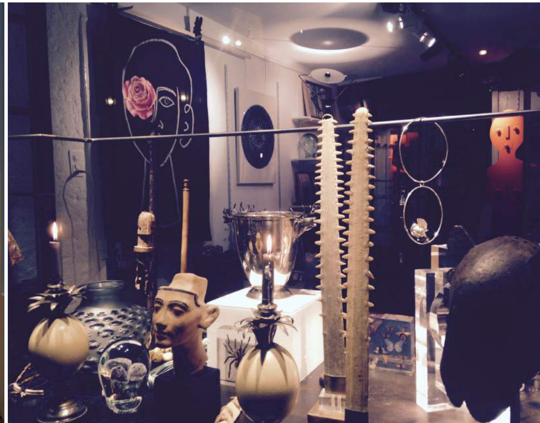
Confluences – Zürich 2016